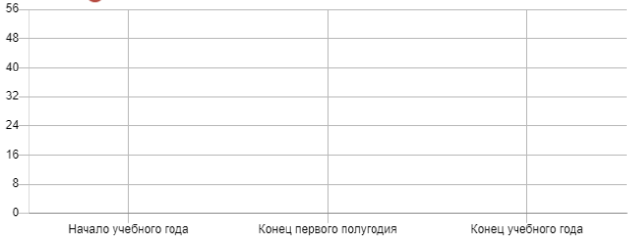
● Итоговый показатель уровня развития и сформированности умений и навыков